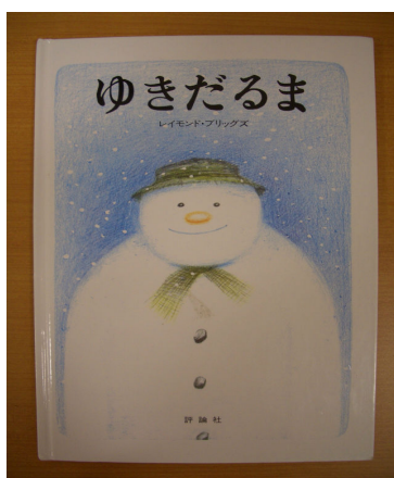
「ゆきだるま」 レイモンド・ブリッグス

口内炎がひどく、食事がとれない場合は、水分だけでもきちんと与えて下さい。(糖分・塩分のあるスポーツ飲料など可)